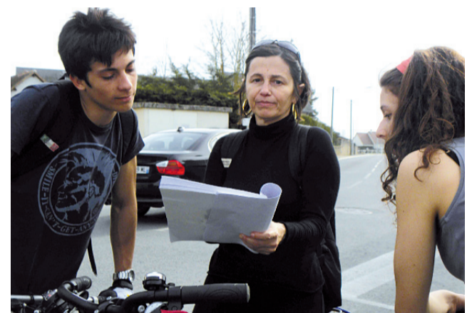
Momenti della gita lungo la Loira: tra una sosta e un occhio alla mappa